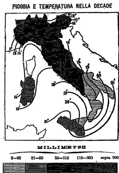
2 a decade di ottobre 1896 «Rivista Meteorico-Agraria», in «Gazzetta del Regno», n. 253, 29 ottobre 1896.

Per le abbondanti piogge su tutto il suo bacino imbrifero, il Tevere entrò di nuovo in piena il 19, 20 e 21 ottobre. Rimase interrotta a Monterotondo presso Roma la ferrovia Roma-Civitavecchia-Pisa e la linea Grosseto-Civitavecchia. Furono allagati i prati della Farnesina, di San Paolo, della Magliana. L'acqua arrivò persino dentro il Pantheon e si fece appena in tempo a ripulire il tempio dall'acqua e dal fango, prima della visita degli sposi reali, il principe Vittorio Emanuele III di Savoia e la principessa Elena Petrović-Njegoš di Montenegro, alla tomba di Vittorio Emanuele II, dopo il matrimonio celebrato al Quirinale il 24 ottobre 4 .